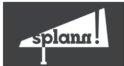
Table Ronde : Quelle alternative aux médias dominants ?