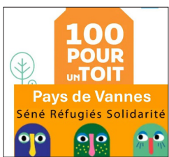
Table Ronde. Les 100 pour 1 Toit, une initiative citoyenne qui mobilise.

■ Samedi 7 Février - 10h30 - Séné - Grain de Sel.