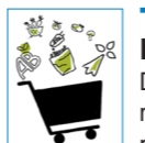
Table Ronde. Paniers Vertueux, Porte-Monnaies Heureux !

■ Samedi 8 février - 14h - Séné - Salle Ty Kelou.