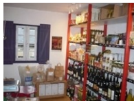
TABLE RONDE : LES GASE EN BRETAGNE DES GROUPEMENTS D'ACHATS

Sam. 29 11H00 BAMAKO (Salle des Expos) SÉNÉ