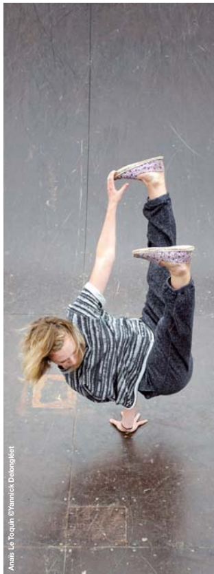
Anais Le Toquin

Nouvelle discipline urbaine : mélange des techniques de foot, de basket avec de la danse et des acrobaties, sur une musique entraînante avec un ballon spécial. URBANBALL est une marque déposée internationalement. Le but du jeu est de réaliser seul ou à plusieurs des figures techniques et spectaculaires en jonglant, avec les parties du corps et en utilisant, pour les joueurs plus experts, l'environnement urbain (murs, rampes d'escaliers, piliers...).